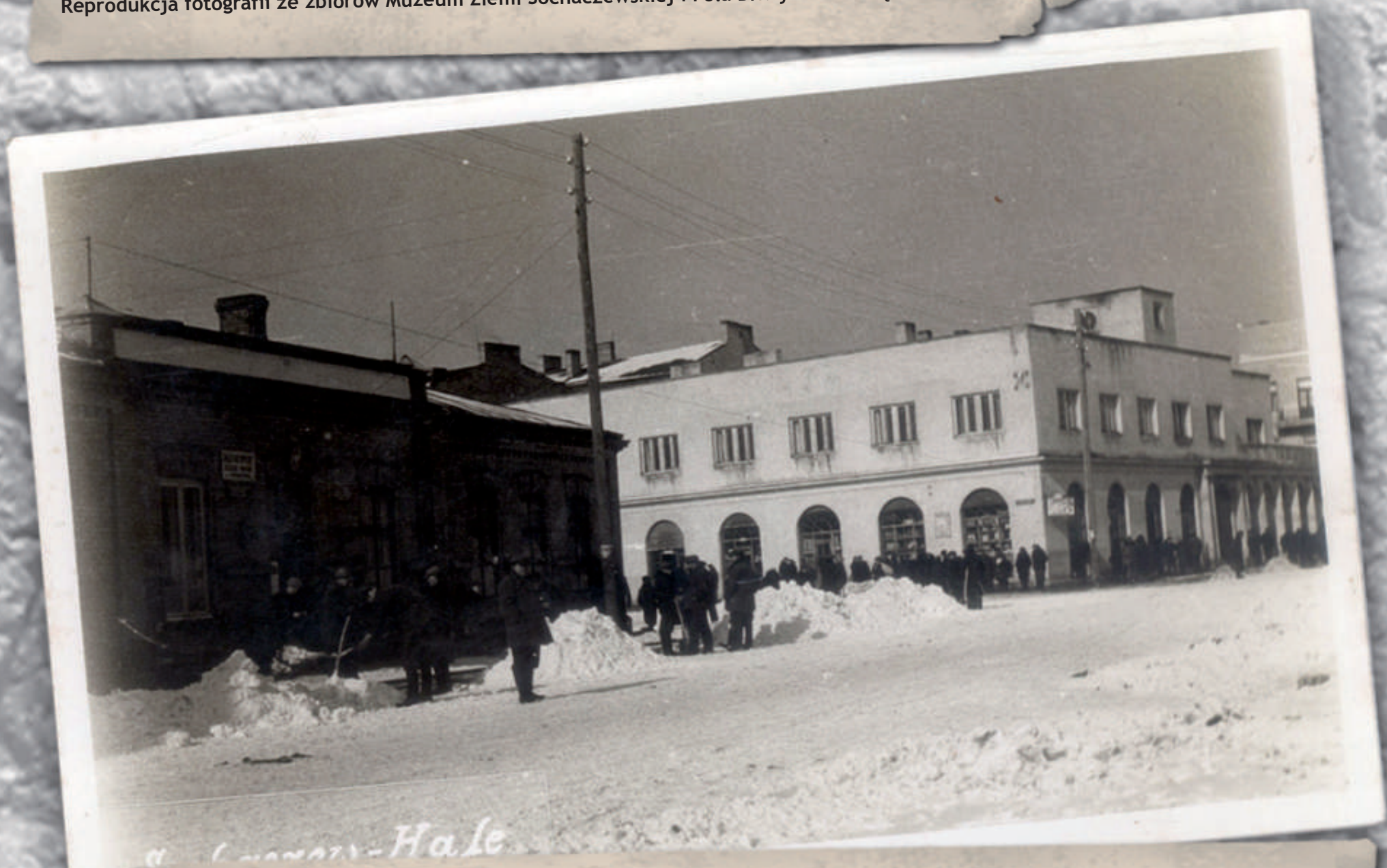
Sochaczew, ul. Piłsudskiego (obecnie 1 Maja). Ujęcie w kierunku północno-zachodnim. Widoczne kolejno budynek posterunku Policji Państwowej (obecnie Banku Pekao SA), wylot ul. Wąskiej oraz gmach hal targowych. Stan z lat 30. XX w. Reprodukcja widokówki z kolekcji Zespołu Szkół Centrum Kształcenia Praktycznego w Sochaczewie.