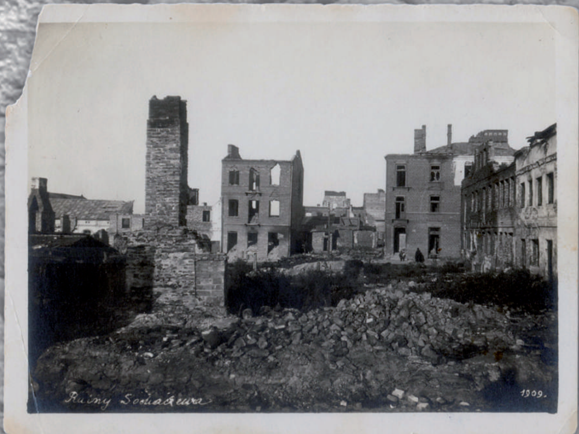
Sochaczew, Pl. POW (obecnie Pl. Armii Ludowej). Ujęcie w kierunku zachodnim. Po prawej fasady tylne zabudowań południowej pierzei ul. Wąskiej. W głębi fasady tylne zabudowań pierzei wschodniej ul. Traugutta. Stan po zniszczeniach z okresu walk rosyjsko-niemieckich podczas I wojny światowej (ok. 1915 r.).