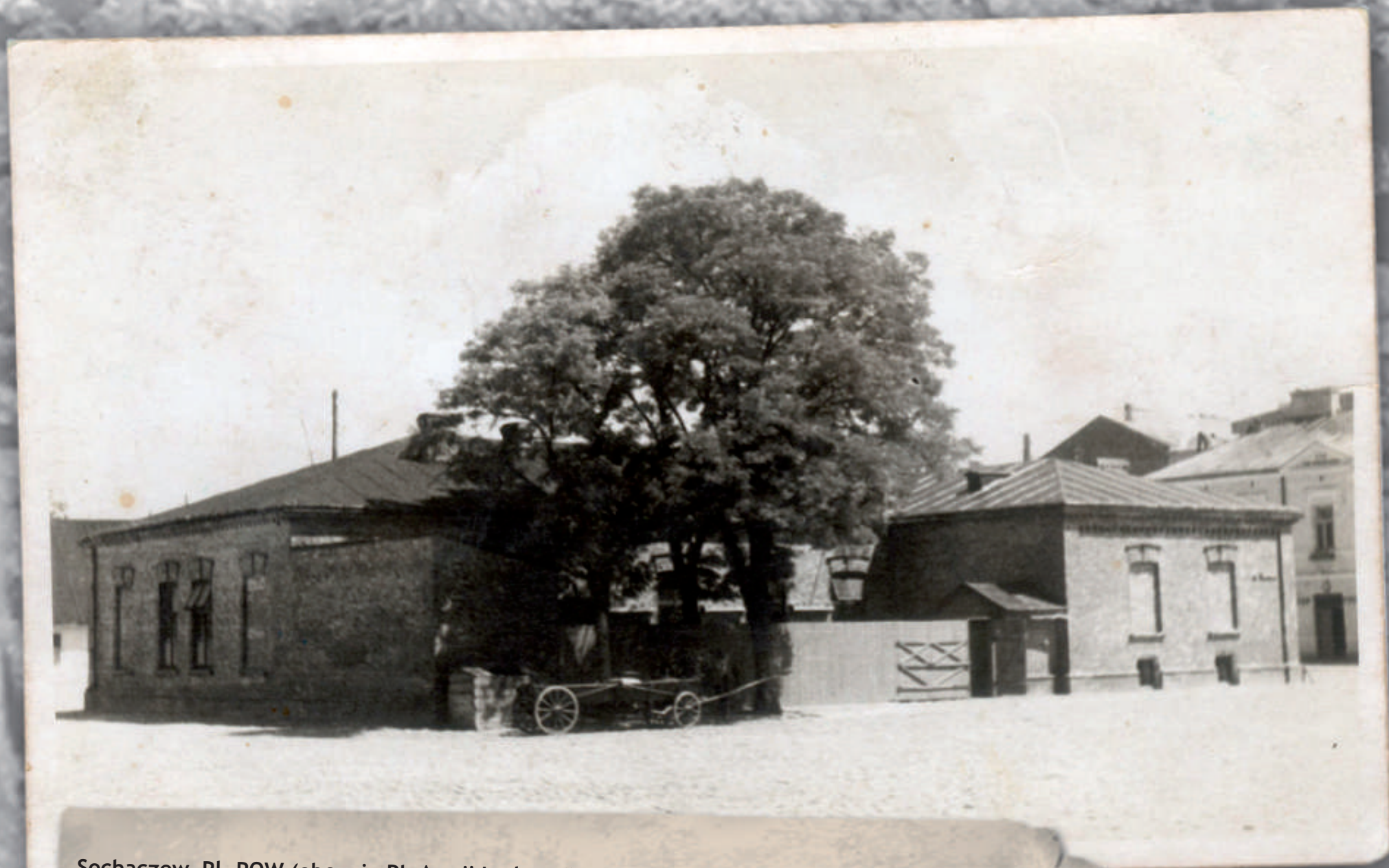
Sochaczew, Pl. POW (obecnie Pl. Armii Ludowej). Ujęcie w kierunku południowo-wschodnim. Na pierwszym planie fasada tylna budynku posterunku Policji Państwowej (obecnie siedziba banku Pekao SA). Stan z okresu międzywojennego. Reprodukcja widokówki ze zbiorów Muzeum Ziemi Sochaczewskiej i Pola Bitwy nad Bzurą w Sochaczewie.