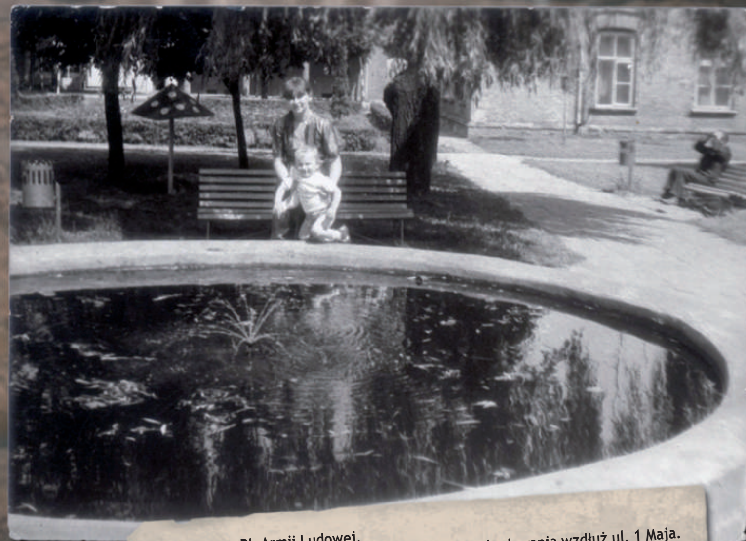
Sochaczew, Pl. Armii Ludowej. Ujęcie w kierunku wschodnim. W tle widoczne zabudowania wzdłuż ul. 1 Maja. Stan z lata 1977 r.