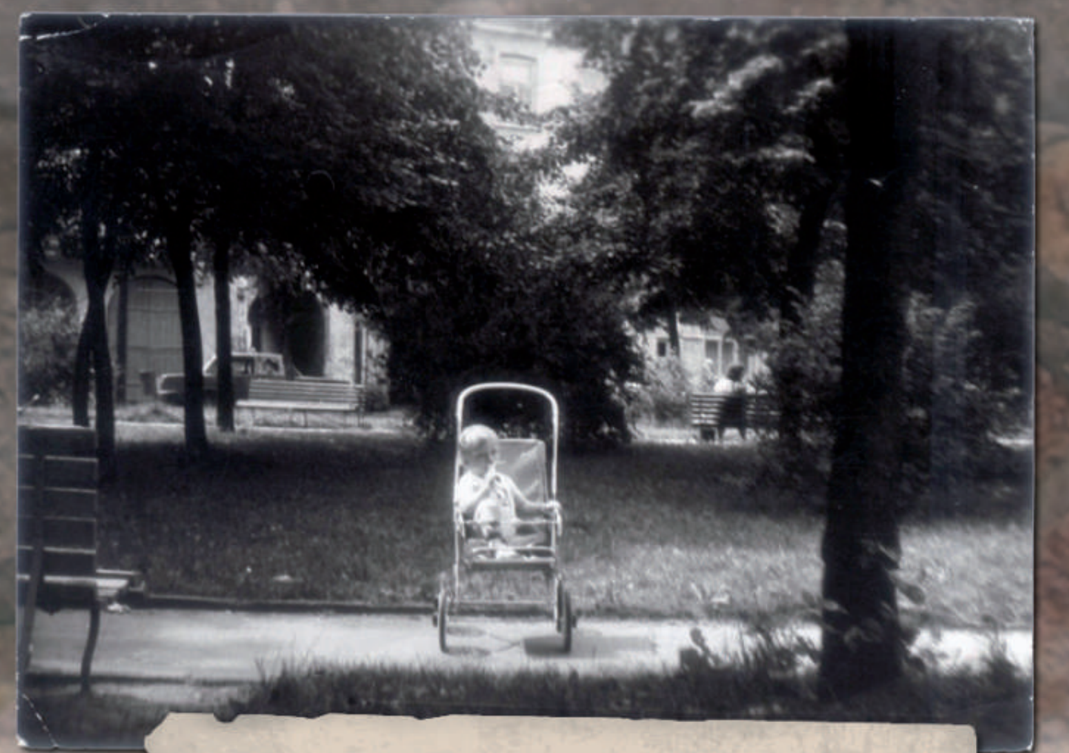
Sochaczew, Pl. Armii Ludowej. Ujęcie w kierunku północno-zachodnim. W tle widoczne zabudowania pierzei zachodniej Placu. Stan z lata 1977 r.