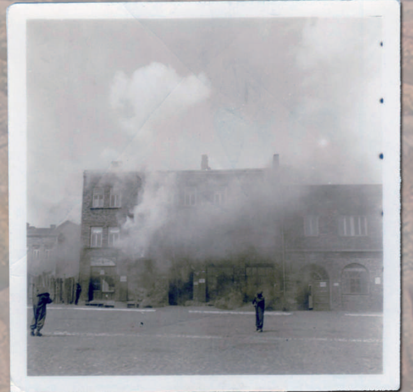
Sochaczew, Pl. POW (obecnie Pl. Armii Ludowej). Ujęcie w kierunku północnym. Widoczna pierzeja północna Placu (wzdłuż ul. Wąskiej) podczas ćwiczeń Ligi Obrony Powietrznej i Przeciwgazowej (L.O.P.P.). Stan z lat 30. XX w. Reprodukcja fotografii ze zbiorów Muzeum Ziemi Sochaczewskiej i Pola Bitwy nad Bzurą w Sochaczewie.