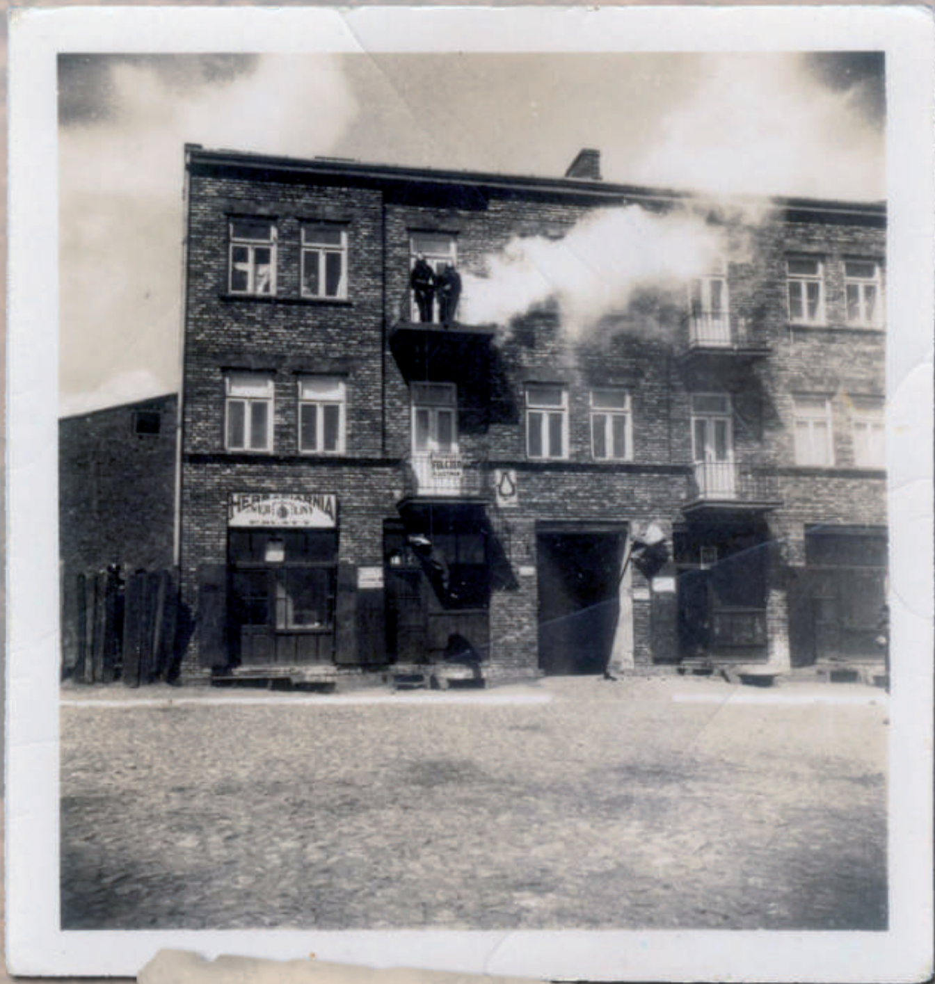
Sochaczew, Pl. POW (obecnie Pl. Armii Ludowej). Ujęcie w kierunku północnym. Widoczna pierzeja północna Placu (wzdłuż ul. Wąskiej) podczas ćwiczeń Ligi Obrony Powietrznej i Przeciwgazowej (L.O.P.P.). Stan z lat 30. XX w. Reprodukcja fotografii ze zbiorów Muzeum Ziemi Sochaczewskiej i Pola Bitwy nad Bzurą w Sochaczewie.