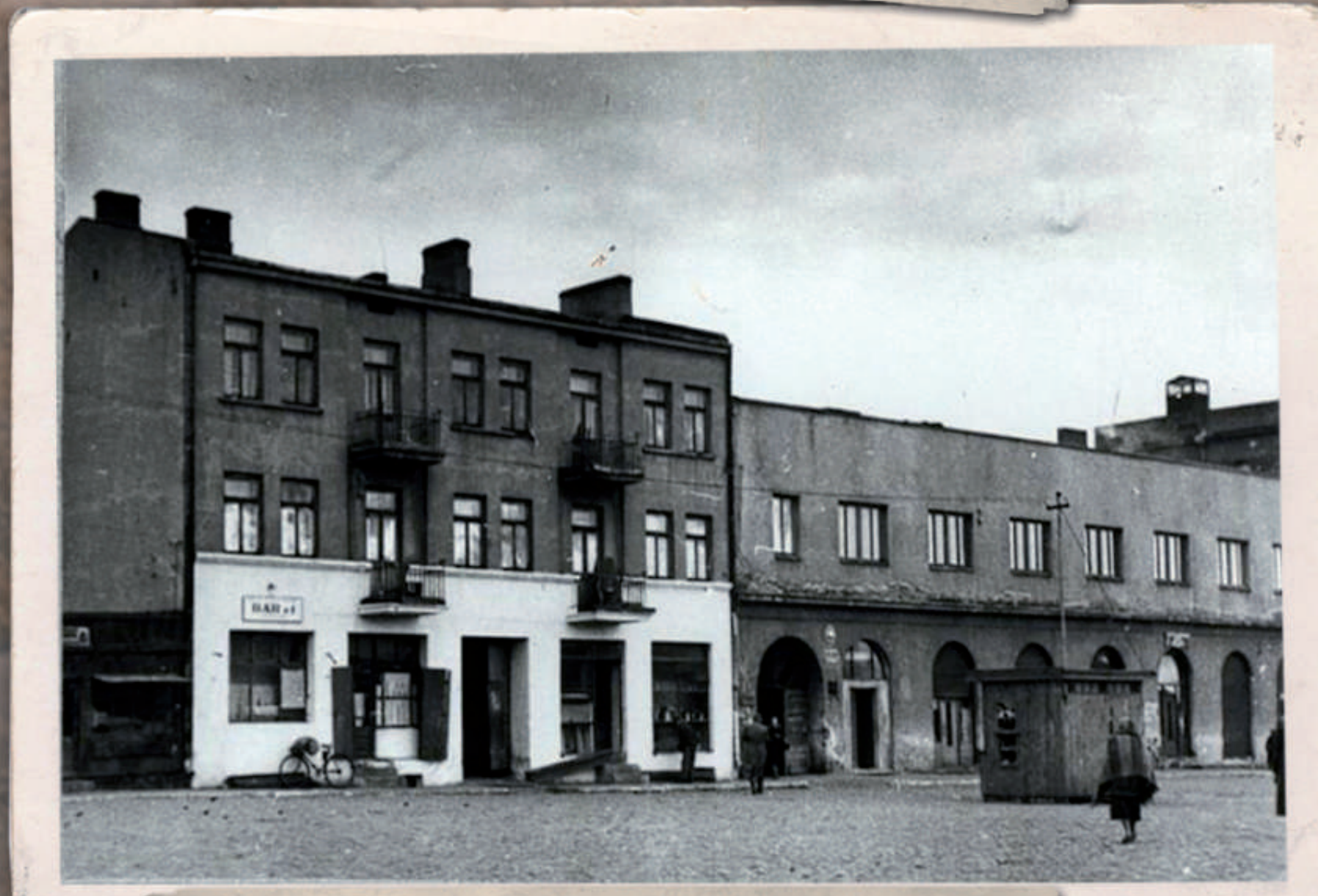
Sochaczew, Pl. Armii Ludowej. Ujęcie w kierunku północno-wschodnim. Widoczny odcinek wschodniej pierzei północnej Placu (wzdłuż ul. Wąskiej). Stan z lat 50. XX w.