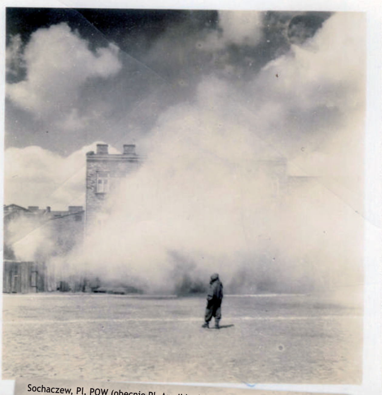
Sochaczew, Pl. POW (obecnie Pl. Armii Ludowej). Ujęcie w kierunku północnym. Widoczna pierzeja północna Placu (wzdłuż ul. Wąskiej) podczas ćwiczeń Ligi Obrony Powietrznej i Przeciwgazowej (L.O.P.P.). Stan z lat 30. XX w.