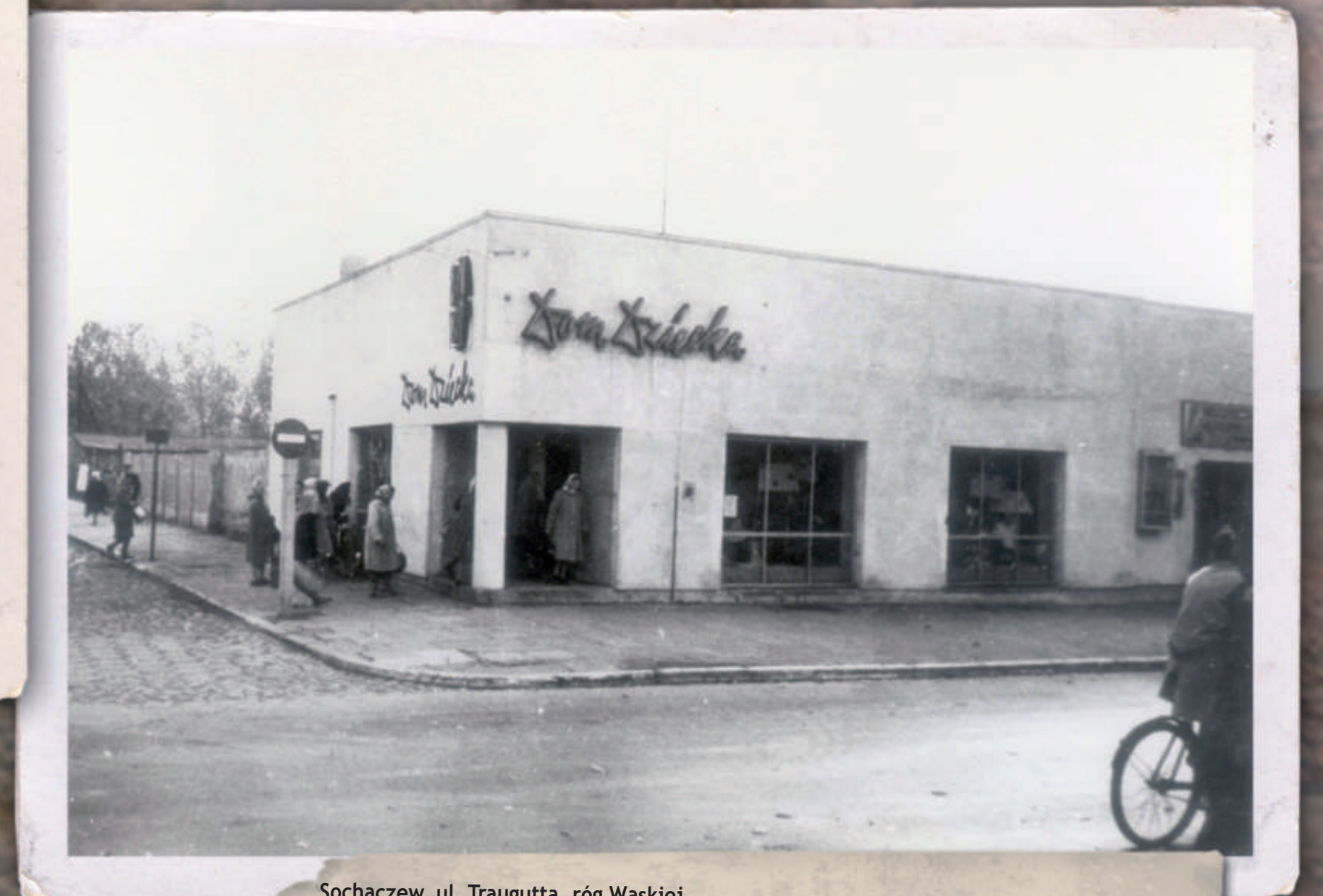
Sochaczew, ul. Traugutta, róg Wąskiej. Ujęcie w kierunku południowo-wschodnim. Stan z 1962 r. Reprodukcja fotografii z Monografii Powszechnej Spółdzielni Spożywców w Sochaczewie w zbiorach Muzeum Ziemi Sochaczewskiej i Pola Bitwy nad Bzurą w Sochaczewie.